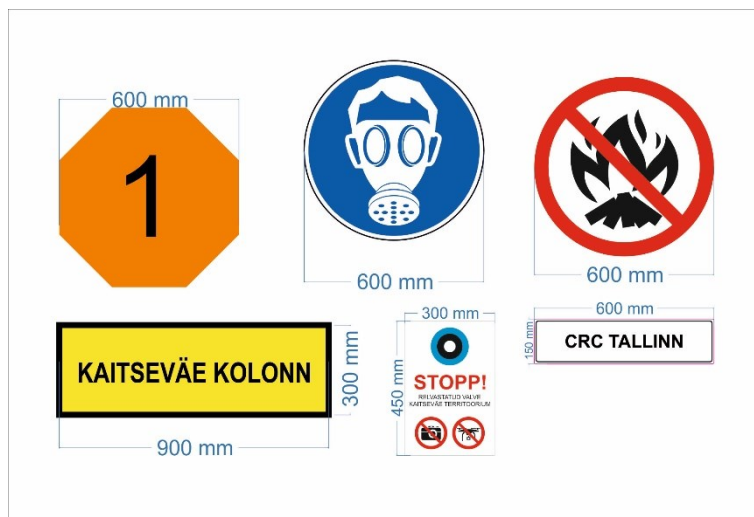
Pildid 3-5. Näidised: